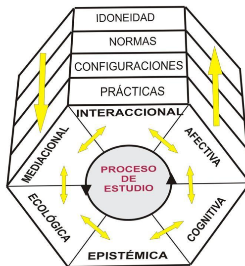
Figura 1. Facetas y niveles de análisis didáctico

“La enseñanza es relacional. Los profesores, los estudiantes, y el contenido sólo se pueden comprender unos en relación a los otros. El profesor trabaja para orquestrar el contenido, las representaciones del contenido, y las interrelaciones de las personas que intervienen en la clase. Los modos de estar de los estudiantes, sus formas de participación, y su aprendizaje emerge de estas relaciones mutuamente constitutivas. La enseñanza es también multidimensional” (Frankle, Kazemi y Battey, 2007, p. 227)